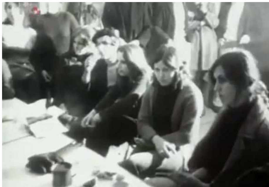
43 GODINE OD SLAMANJA HRVATSKOG PROLJEĆA