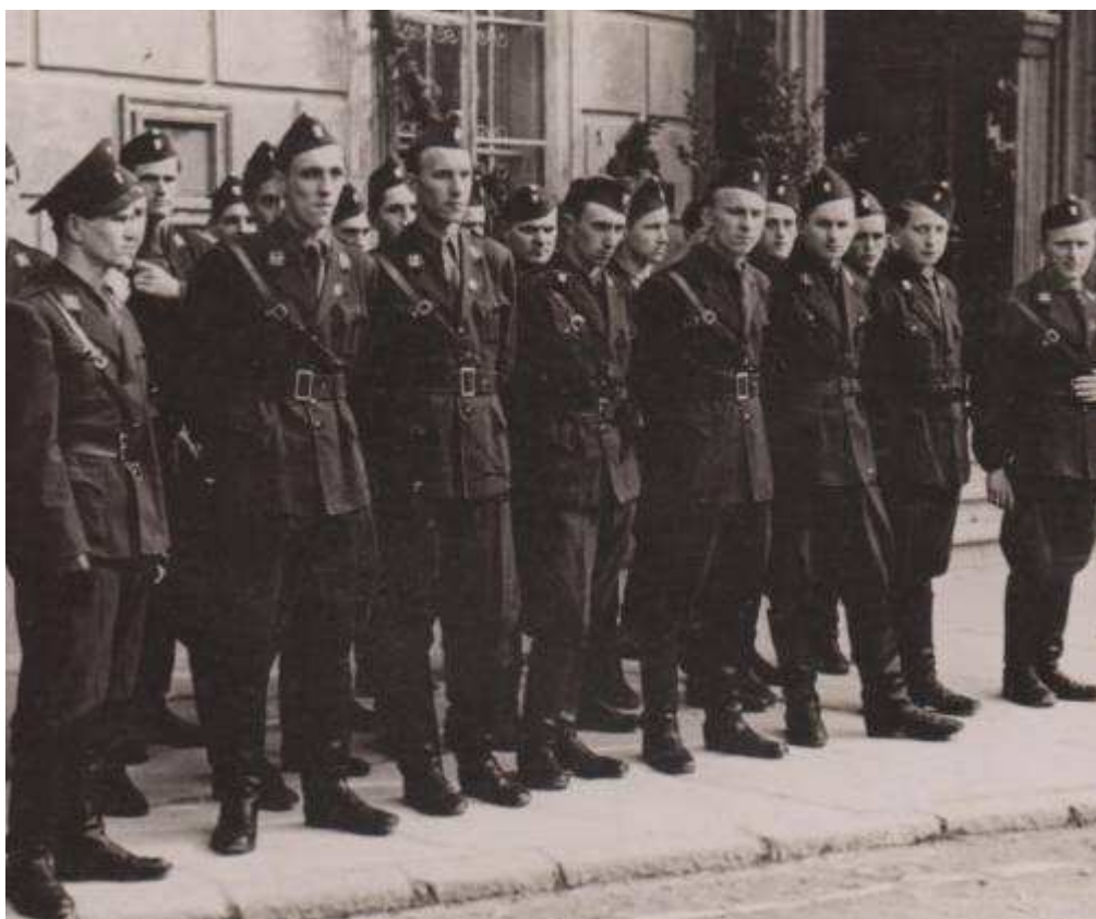
Ustaše ispred varaždinske gradske vijećnice