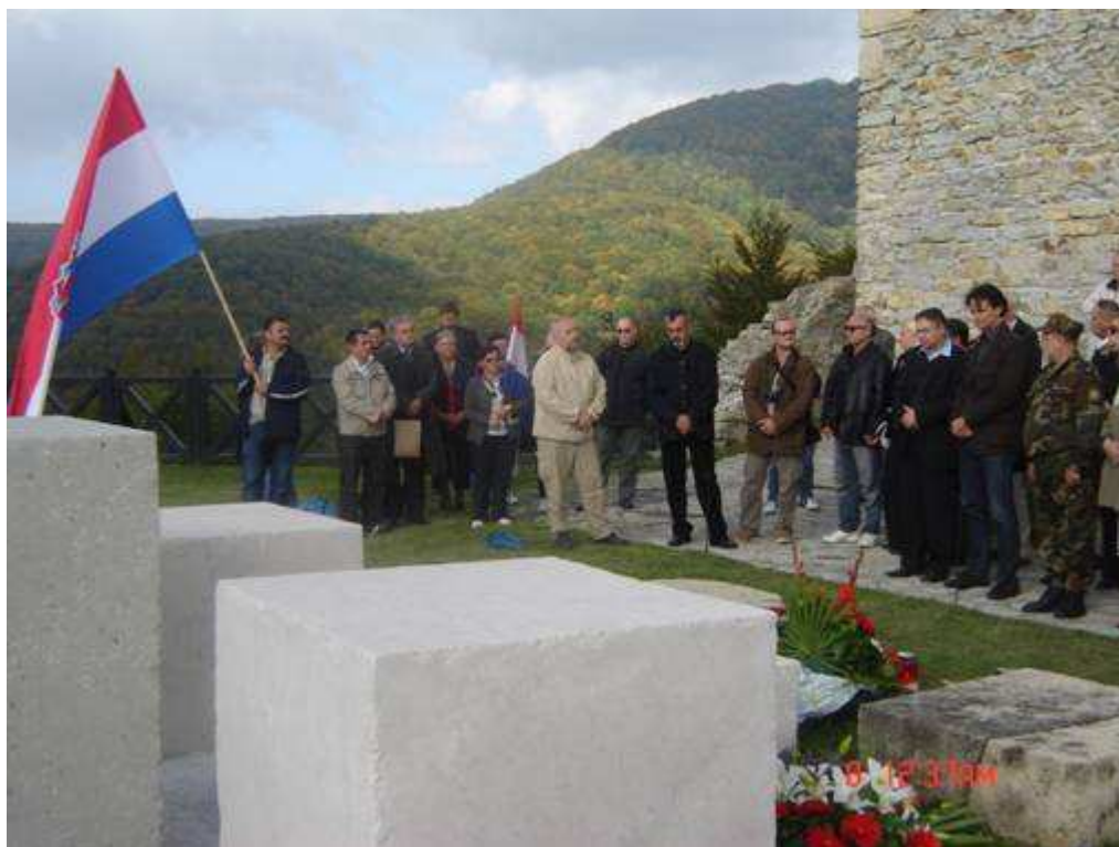
Obraćanje izaslanika ravnateljice Javne ustanove Park prirode Medvednica

Pjesmom zbora Hrvatska Baščina "Bože čuvaj Hrvatsku"