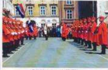
Podobolno prava poti: 1991/2012

Handwritten notes in blue ink: Podobolno prava poti: 1991/2012 V. Kager V. Kager V. Kager Stamp: Generalu HV Branitelju Elazaru Signature: Dubravko Stokich