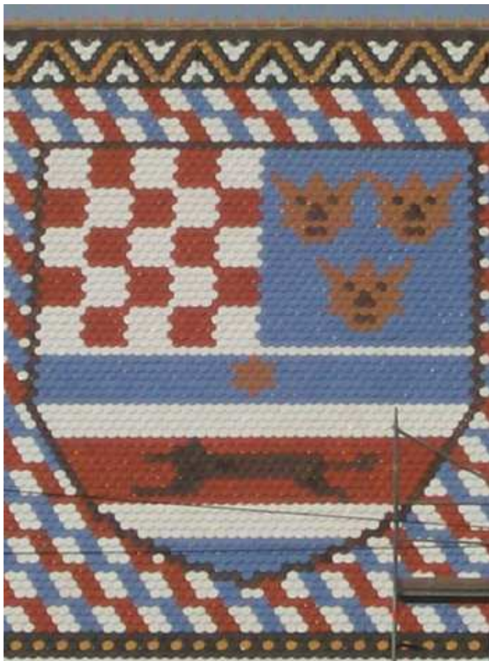
Detalj s krova crkve sv. Marka na Gornjem gradu u Zagrebu

U Hrvatskoj je raširen sindrom Lazara Lakića. Jeste li čuli za tu pošast? Ako niste, onda vas molim da prvo pročitate vijest koja je objavljena 2005. godine: