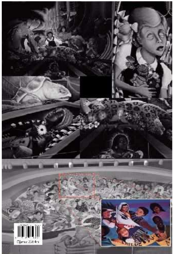
Detalji murala s aerodroma u Denveru