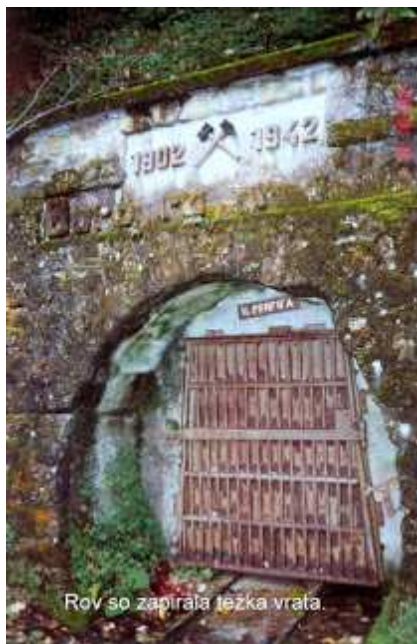
Slika: Vhod v rov Sv Barbare pred odkritjem grobišča

begunce, ki so v neskončni koloni potovali iz Savinjske doline proti Hrastniku.« Kaj je bilo z njimi« sem spraševal. »Nič, pobili so jih za Hrastnikom.« S strahom sem gledal majhnega, tršatega možakarja, za katerega so pravili, da je pred poboji, komaj šestnajstleten, z dolgim cvekom zategoval žico, s katero so jetnikom vezal roke. No, kmalu potem se je obesil. Oče je pravil o mladem, visokem Dolenjcu, ki je pred streljanjem skočil v brezno, nato pa po ušel iz jamskih rovov in neko noč prišel na njihovo kmetijo. Ko se je najedel in napil, je šel naprej. Tudi ob drugih priložnostih so starejši možje, zlasti če so se napili, govorili o pobojih. Nihče pa ni hotel govoriti konkretno in po vprašanjih so umolknili. Poboji so ostali kot zlovščica skrivnost. Zato sem spomladi 2008, ko so me postavili za vodjo Službe za vojna grobišča, skušal napraviti vse, da bi odkrili katerega od zasavskih množičnih grobišč. Prva izbira je bila Huda jama. Komisija za vojna grobišča je to načrtovala že od svoje ustanovitve takoj po letu 1990, vendar se dela ni nihče lotil zaradi neprehodnih birokratskih ovir.