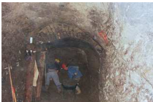
Slika: Rudarji so kopali kar na roke, kramp, lopata in hunti