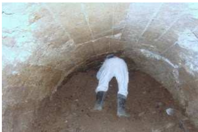
Slika: Kaj je za zasutjem