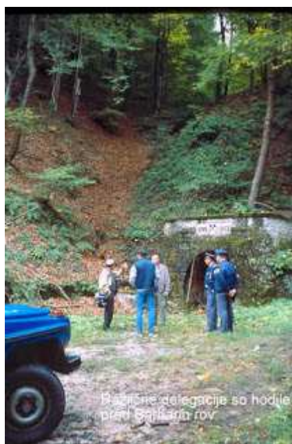
Slika : Komisijski ogled Barbara rova

Okoličani so ves povojni čas vedeli, da so knojevci po vojni v rudniku pobili množico ljudi, vendar v prejšnjem režimu tega niso upali podvedati naglas. Po letu 1991 so začele k Rovu Sv. Barbare zahajati različne komisije.