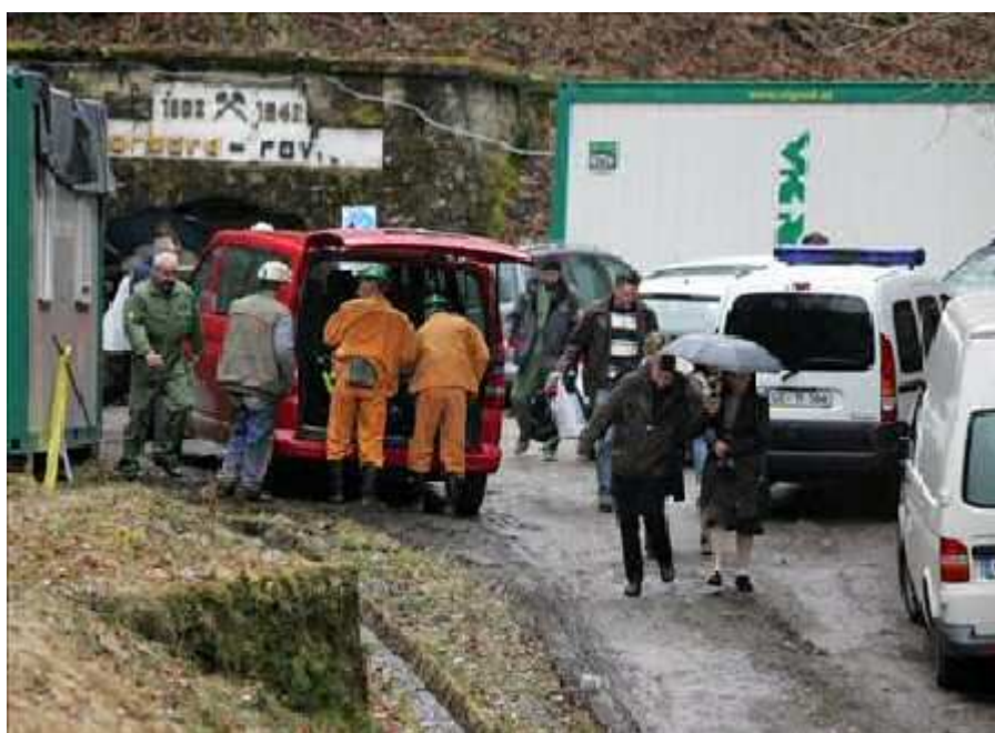
STA Foto: STA, BOBO