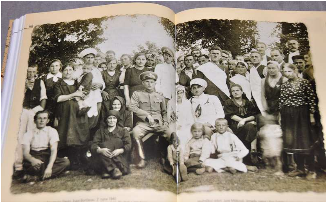
Boričevac, 2. rujna 1940.