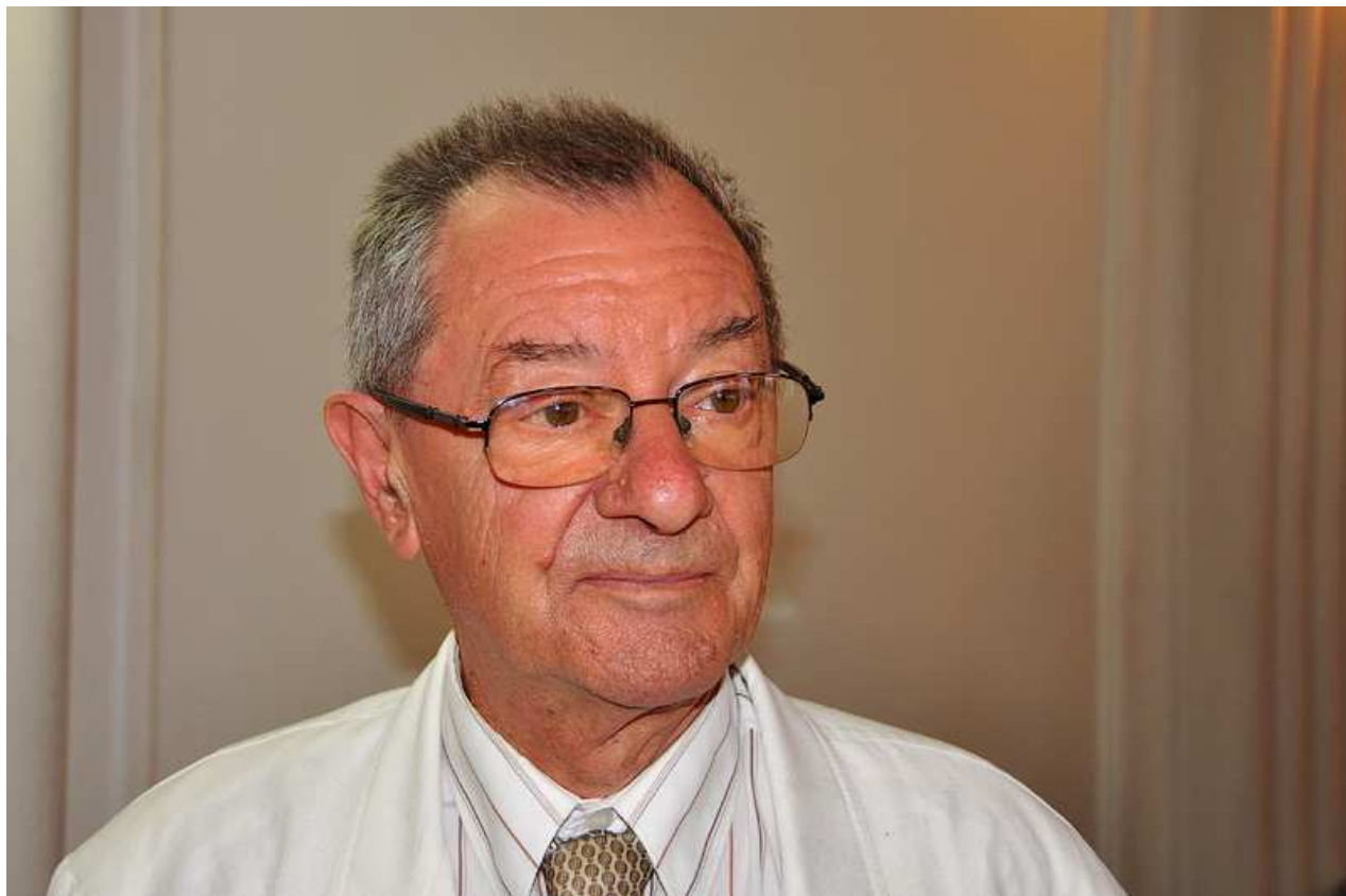
Akademik Dubravko Jelčić