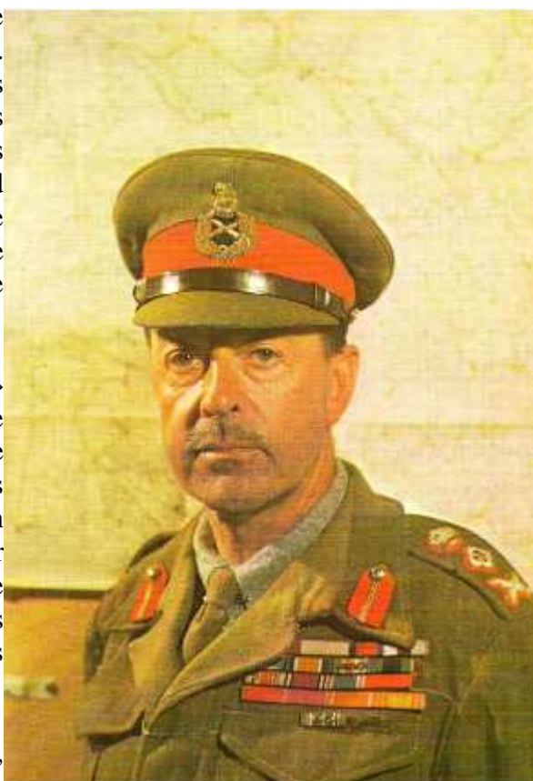
H. Alexander