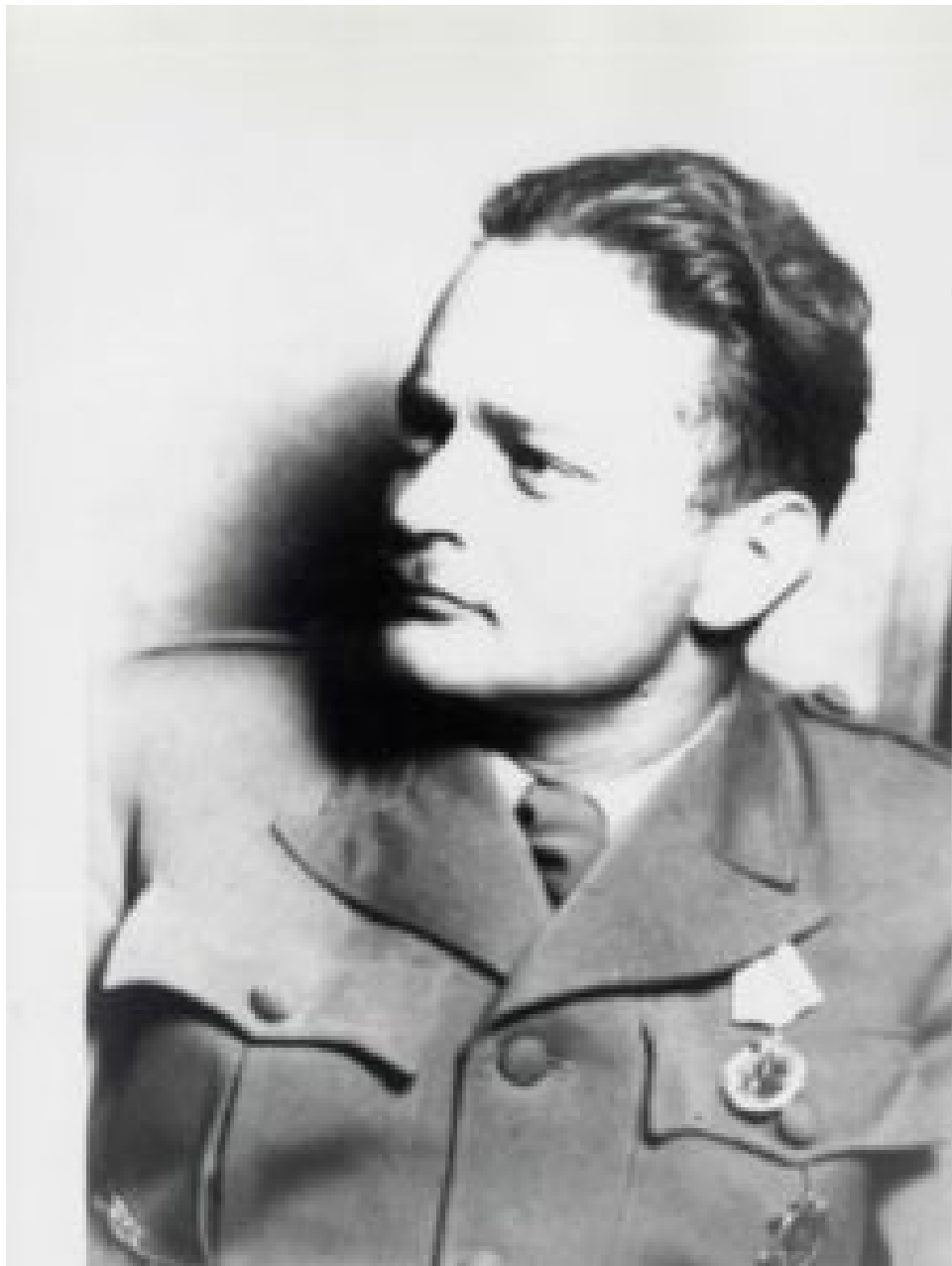
Boris Kidrič

General Cerutti se je 9. septembra 1943 v Novem mestu uradno zvezal z vodstvom Osvobodilne fronte, ki je komunistični “narodno-osvobodilni vojski” uradno izročil vse težko orožje, topove, tanke, avtomobile in skladišča divizije “Isonzo” v Novem mestu ter s tem pripomogel k poznejšemu uničevanju naše domovine po komunističnih tolpah. Isti general Cerutti je iz Novega mesta poslal okrog 1500 slovenskih protikomunistov v smeri proti Straži, da bi padli v komunistične zasede. Vsi bi bili pobiti, če ne bi bili te Ceruttijeve nakane zadnji trenutek opazili in se rešili. Isti general Cerutti je iz Novega mesta, 13. septembra 1943, prepeljal 2000 svojih vojakov na Bloke, prevzel vodstvo napada na to vas, kjer so se zbirali protikomunistični borci, ter s svojim topništvom pomagal neznatni peščici komunistov, da je kraj delno porušila, ga zavzela in začela na debelo pobijati. Isti Cerutti se je po tem slavnem vojaškem dejanju proti Slovincem udeležil slavnostne pojedine na Blokah ter s članoma Izvršnega odbora Osvobodilne fronte Borisom Kidričem in Edvardom Kocbekom ter poveljnikom rdeče divizije Perom Popivodo sredi podrtin popival v proslavo svoje poslednje zmage nad slovenskim narodom.