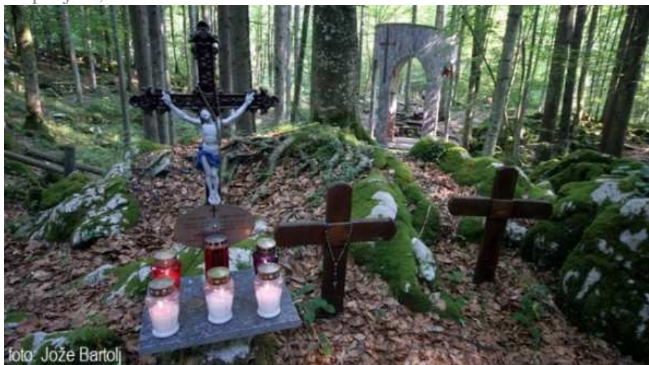
Tko je i kak ubijao Hrvate u Kočevskome Rogu?

U šumi Brezovici pokraj Siska na 'Dan antifašističke borbe' premijer Zoran Milanović poručio je kako su okupljeni u Brezovici s ciljem prisjećanja onoga što se dogodilo prije 73 godine. Svi koji su bili u šumi Brezovici moraju otići na Kočevski Rog i pokloniti se oko 40.000 poklanih Hrvata i to od strane tzv. 'antifašista', odnosno partizana komunističkih.