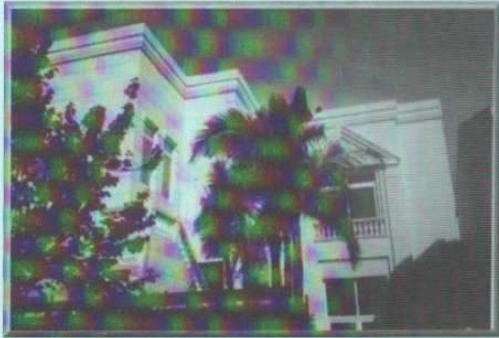
Hrvatski Dom Buenos Aires