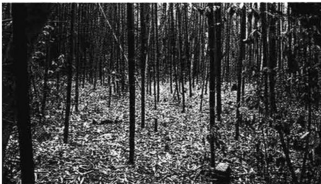
● Ostaci ljudskih kostiju među brijunskim bambusima