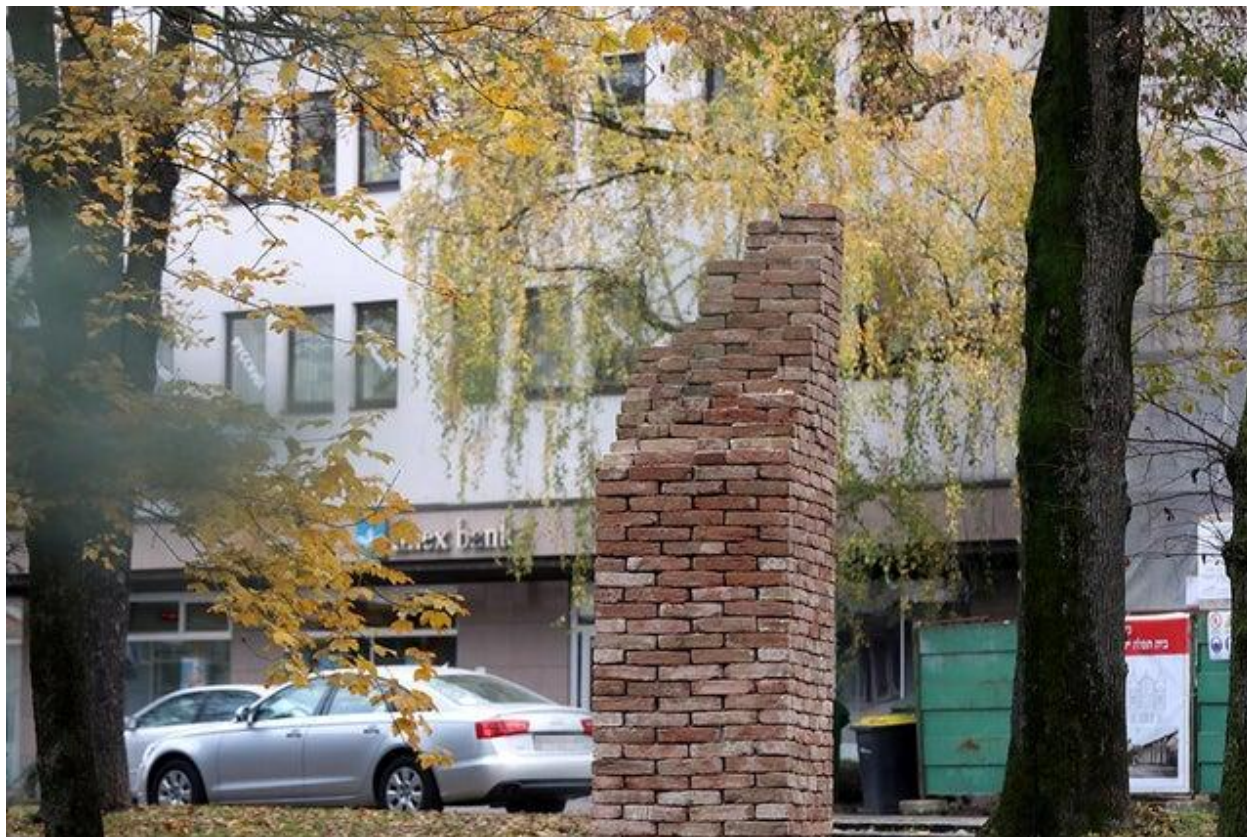
Varaždin, skulptura od cigla, 50 tisuća kuna