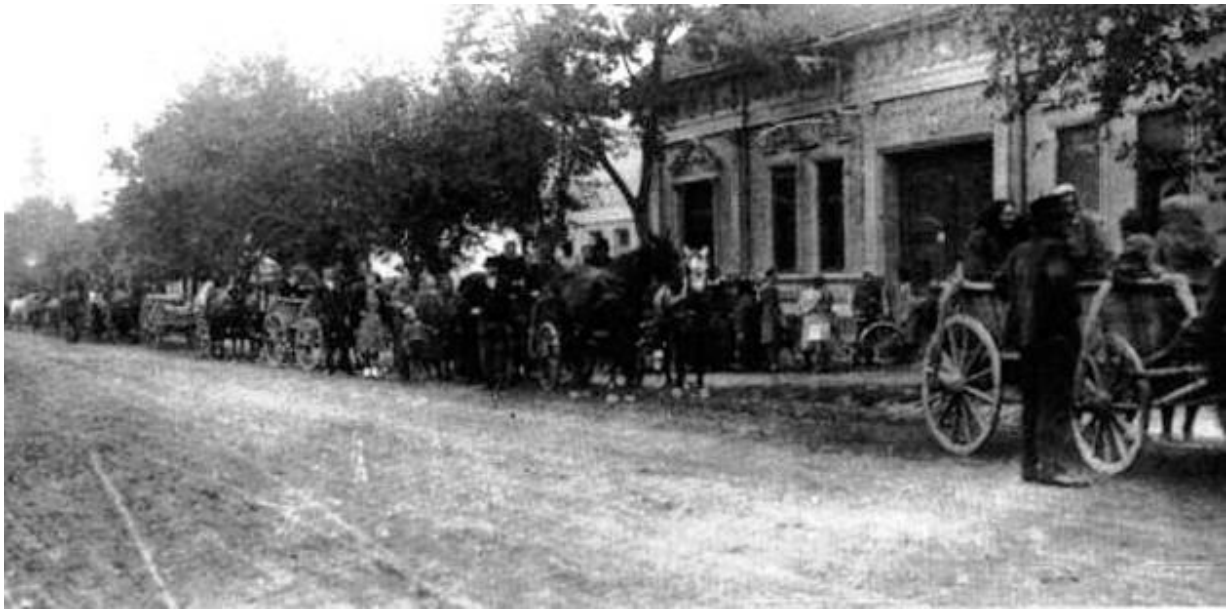
Zbjeg Nijemaca civila iz Hrvatske 1945.