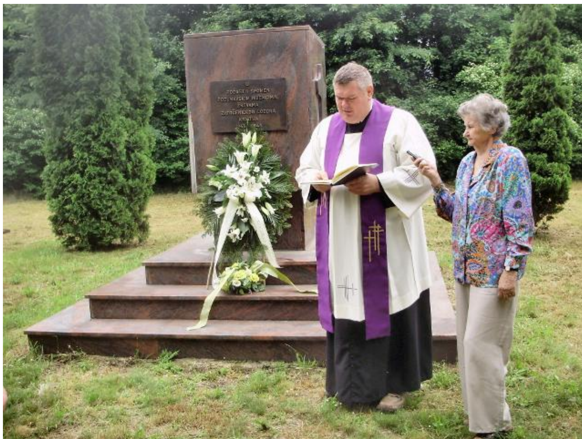
Spomen-obilježje u Krndiji podignuto 1999.

Klikni "svi za mi se" podrži komunistickizlocini.net