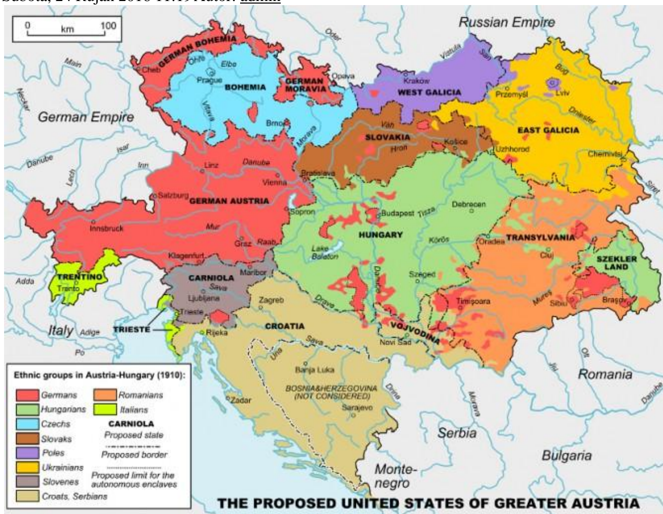
Foto: Wikimedia Commons / Andrei nacu Predložene unutarnje granice Sjedinjenih Država Velike Austrije koje su pratile etni ke podjele unutar Habzburške monarhije. Foto: Wikimedia Commons / Andrei nacu

Subota, 24 Rujan 2016 11:19 Autor: admin