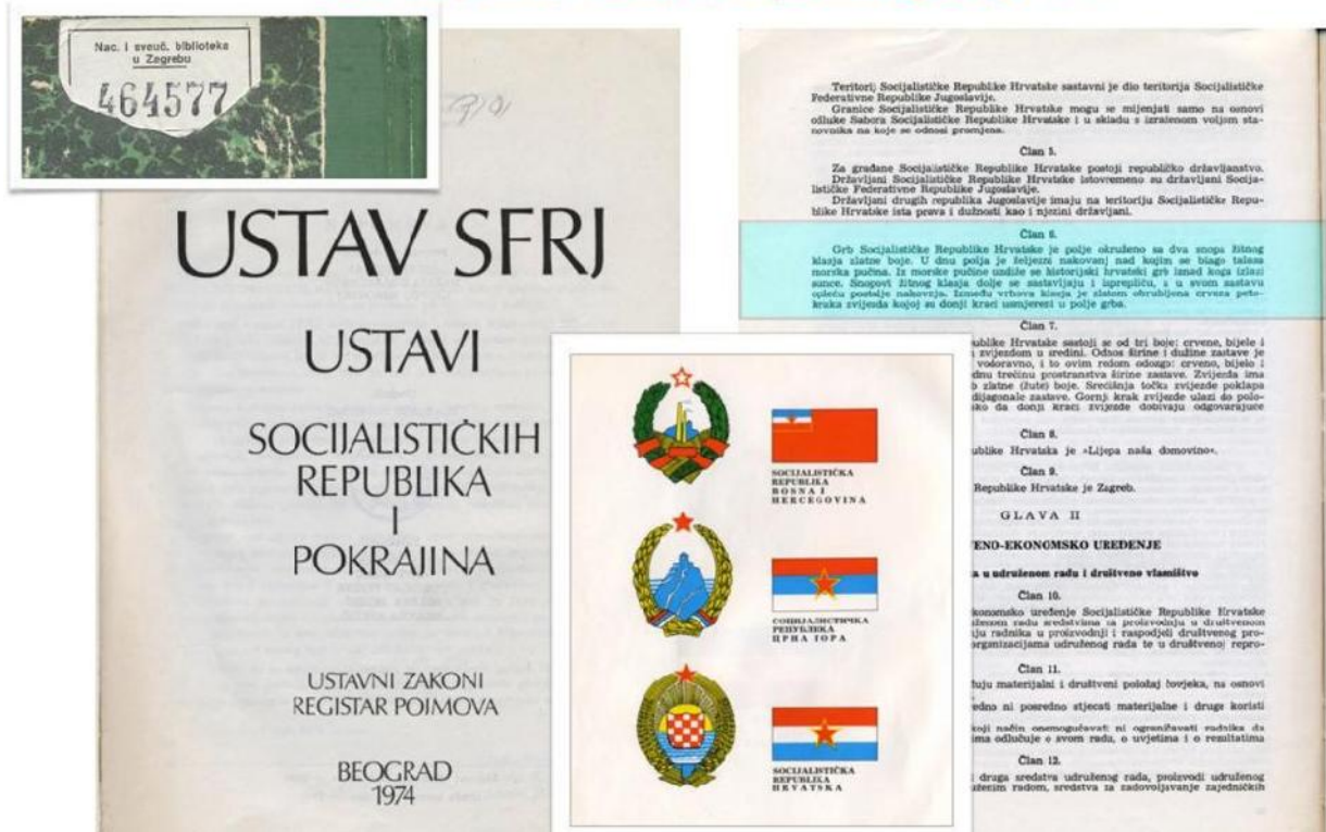
Slika 4 Ustav iz 1974. tako er navodi prvo bijelo polje u hrvatskom grbu

U povijesti se hrvatski grb s prvim bijelim poljem pojavljuje davno prije NDH, ve krajem 15. stolje a (prema magistrici Ingrid Runti , 1495 a nalazi se u Innsbrucku)! Josip Horvat navodi da se trebaju uvažavati Odluke Sabora u Cetingradu iz 1527, te odluke Hrvatskog Državnog Sabora iz 1883. U kojoj je zapisano: 'Grb Hrvatske je srebreno i crveno, 25 puta kvadratni štit, tako da je prvi kvadrat srebreni, drugi crveni i tako redom' (Slika 5 i 6). U povijesti se pojavljuju hrvatski grbovi s bijelim ( sl. 7 i 8) i crvenim po etnim poljem i oba su jednako hrvatska. Danas je službeni grb s po etnim crvenim poljem, što ne zna i da razli ite udruge ne mogu koristiti i grb s prvim bijelim poljem.