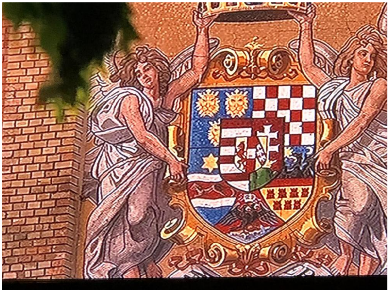
Slika 8. Za vrijeme Austrougarske, u zajedni kom grbu, vidi se hrvatski grb s po etnim bijelim poljem. Što se ti e naziva 'HOS', smeta li nekima što hrvatska ima ZNG (Zbor narodne garde), HOS (Hrvatske Oružane Snage), elitne brigade, domobranske pukovnije... Sve je to HV (Hrvatska vojska). Ili vam