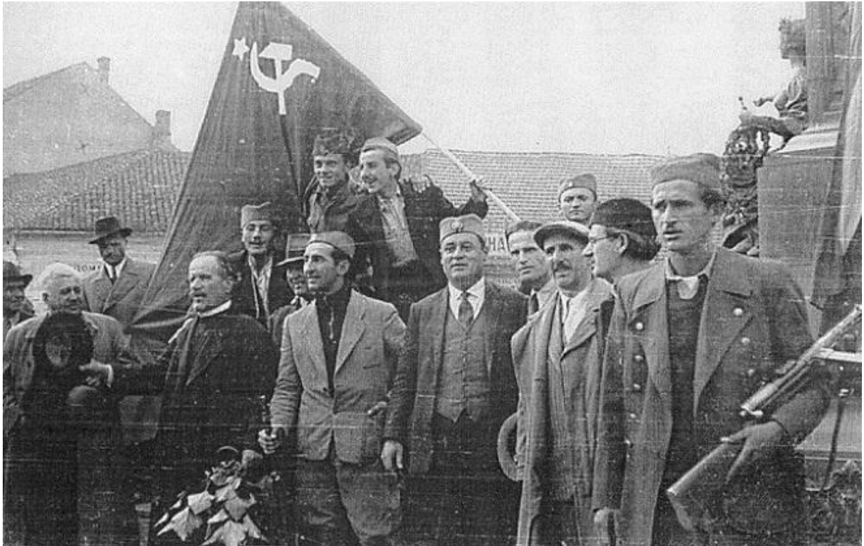
Ravna Gora, prolje e 1944, etnici i partizani prije nekog slavlja

“Radi ostvarenja Srbinove osnovne zamisli i stvaranja srpske nacionalne države, formirat e se kao jedan inilac te zamisli, u reonu Kosova polja ‘Dinarska divizija’ od izrazito nacionalnog elementa. Ta divizija ponikla na istoimenom polju, gde je nekada bilo groblje srpske slave i srpskog junaštva, ima da dade izraza vaskrsnute Srbinove vojni ke mo i, i da kao jedan veliki gvozdeni malj, vaspostavi isto nacionalni poredak u svim zemljama gde žive Srbi, pa i u onima na koje Srbi aspiriraju ... da širi i ostvaruje srpsku ideju u delovima Like, severne Dalmacije, Hercegovine, Crne Gore i Bosne.