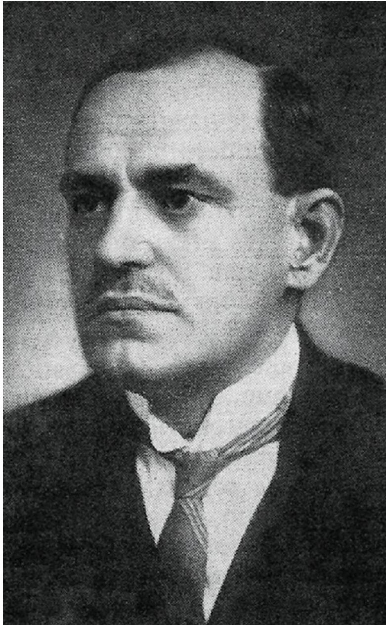
Svetozar Pribićević . I drugi potpredsjednik Narodnog vijeća Slovenaca, Hrvata i Srba zagovarao je povezivanje s Kraljevinom Srbijom